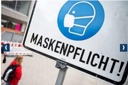
Maskenpflicht herrscht an vielen öffentlichen Orten.

Wie viele Menschen sind erkrankt? Was ist heute wichtig? Welche Veranstaltungen fallen aus? Verfolgen Sie die aktuelle Berichterstattung der BZ im Newsblog zu Corona im Kreis Emmendingen.